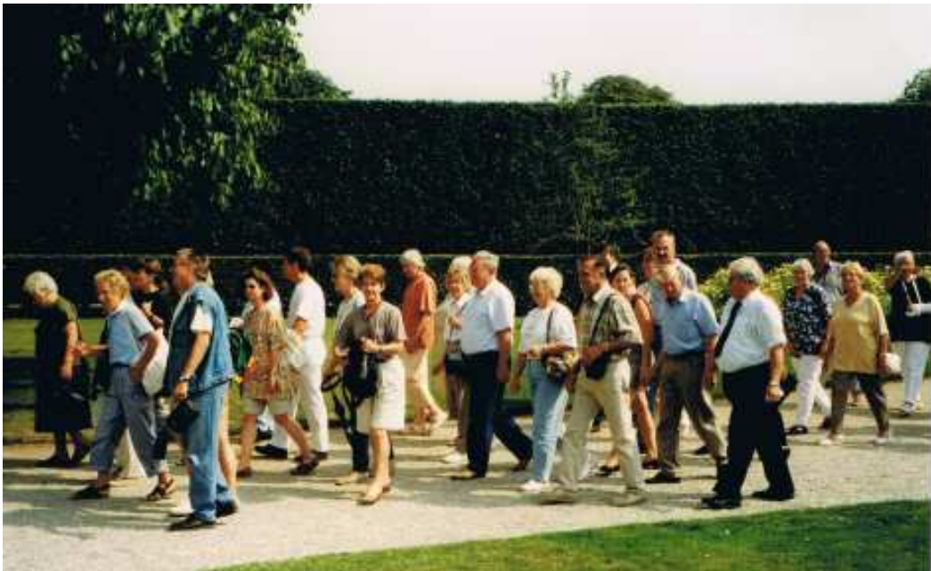
Ein wunderschöner Tag, an dem viel gelacht und gequatscht wurde!