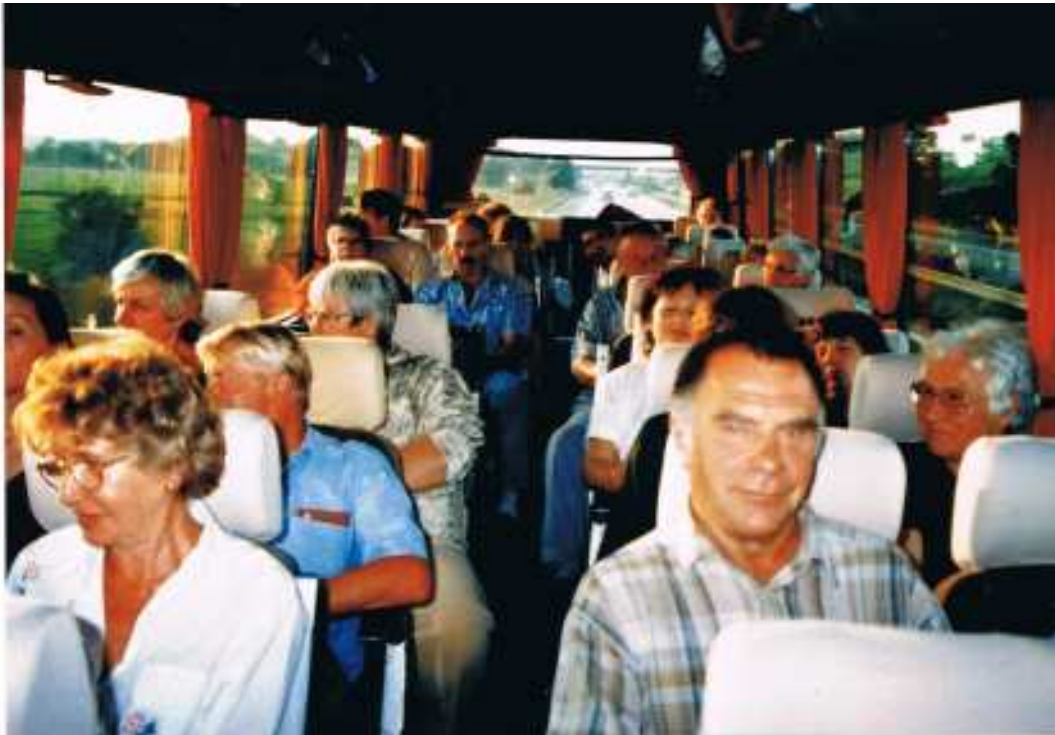
Alle genießen bei herrlichem Sonnenschein die Bus- und Schifffahrt!