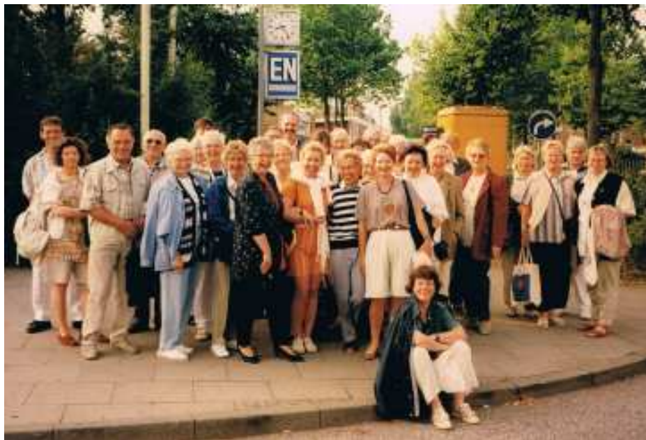
Abfahrt 8.30 Uhr - ZOB Elmshorn